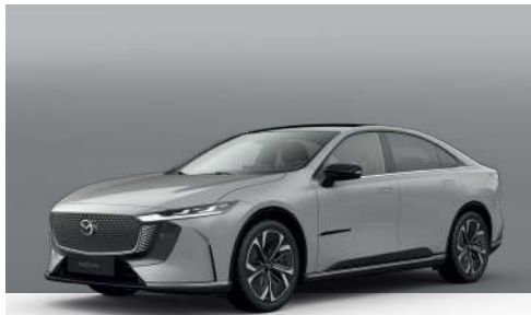
AERO GREY | €850 €714,29