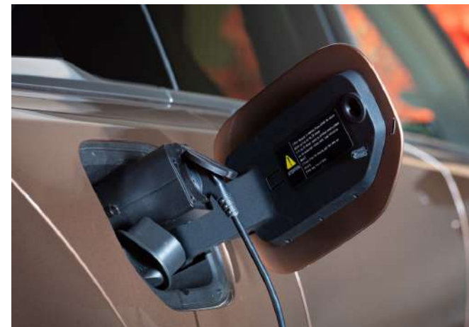
VEHICLE-TO-LOAD (V2L) ADAPTER