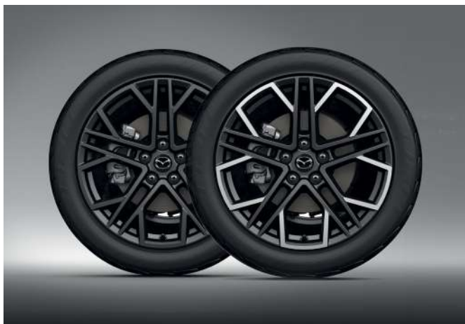
19-ZOLL-LEICHTMETALLFELGE, DESIGN 77, ANTHRAZIT GLÄNZEND / DESIGN 77A, DIAMANTSCHLIFF