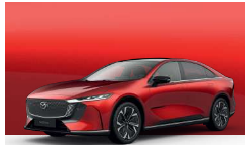
SOUL RED CRYSTAL | €1.200 €1.008,40