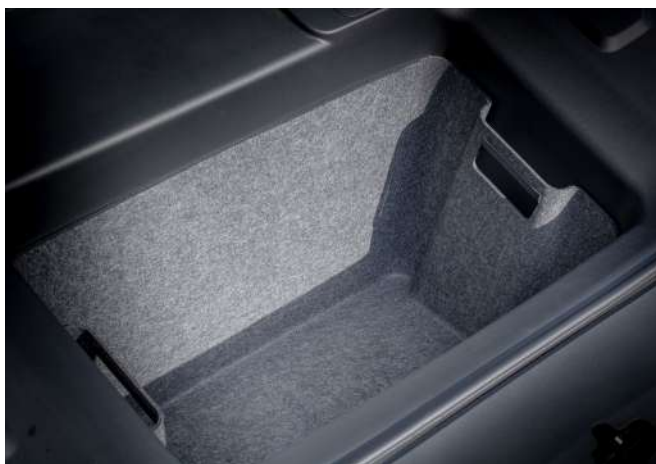
GEPÄCKKRAUMEINSATZ (FRUNK BOX)