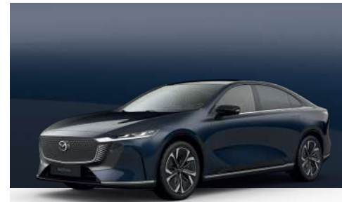
DEEP CRYSTAL BLUE | €850 €714,29