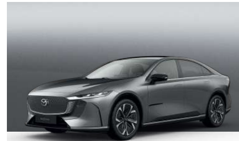
MACHINE GREY | €1.050 €882,35