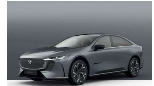
POLYMETAL GREY | €1.050 €882,35