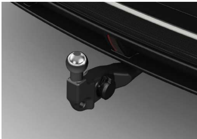
ANHÄNGEZUGVORRICHTUNG, ELEKTRISCH SCHWENKBAR