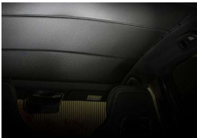
SONNENBLENDE FÜR PANORAMA-GLASDACH (NUR TAKUMI)