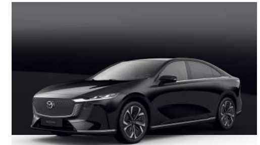
JET BLACK | €850 €714,29

Verwenden Sie unseren Konfigurator, um den Mazda6e zu finden, der perfekt zu Ihnen passt.