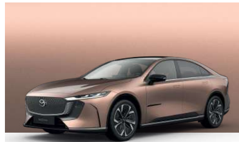
MELTING COPPER | €850 €714,29