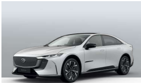
CRYSTAL WHITE PEARL | ohne Aufpreis