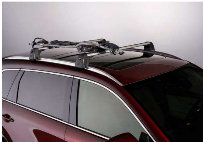
FAHRRADTRÄGER FÜR EIN FAHRRAD