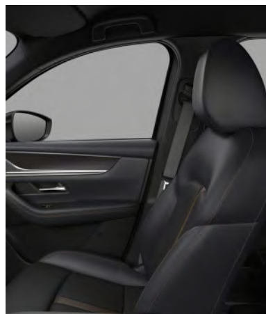
Sitzbezüge aus Nappaleder in Schwarz 1) (HOMURA UND HOMURA PLUS)