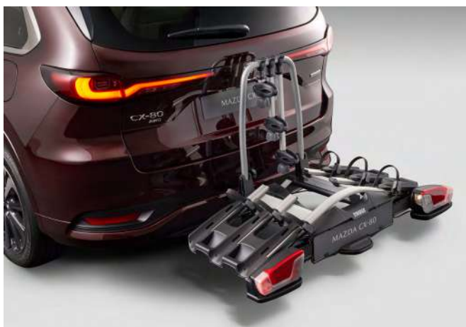
HECKFAHRRADTRÄGER FÜR DREI FAHRRÄDER