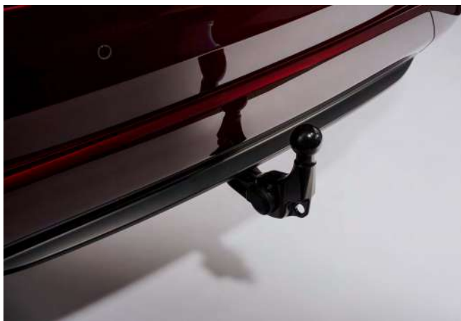
ANHÄNGEZUGVORRICHTUNG, TEIL-ELEKTRISCH SCHWENKBAR