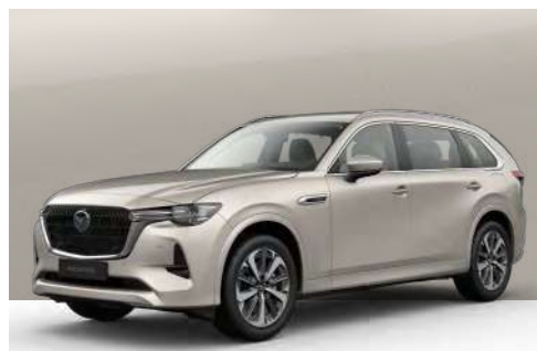
PLATINUM QUARTZ | €850 €714,29