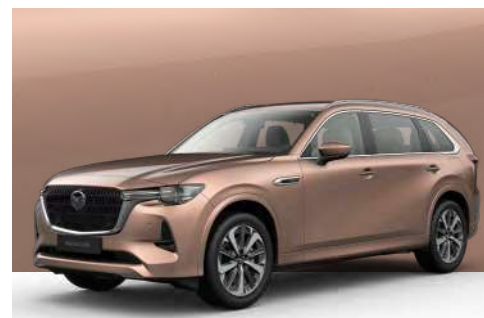
MELTING COPPER | €850 €714,29