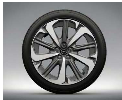
20-Zoll-Leichtmetallfelgen – Diamantschliff (TAKUMI UND TAKUMI PLUS)