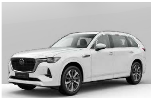
ARCTIC WHITE | ohne Aufpreis