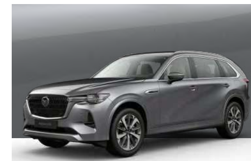
MACHINE GREY | €1.050 €882,35