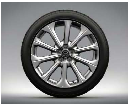
20-Zoll-Leichtmetallfelgen – Silbergrau mit Hochglanzfinish (EXCLUSIVE-LINE)