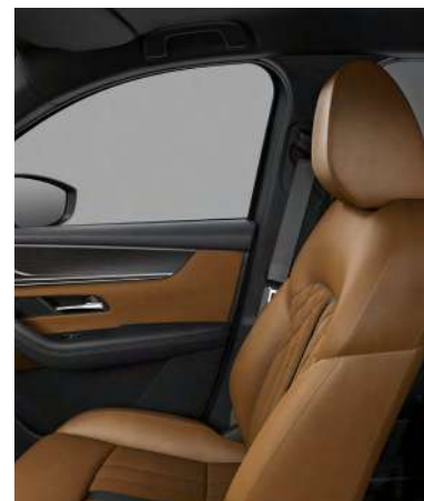
Sitzbezüge aus Teil-Nappaleder in Hellbraun 2) (OPTIONAL FÜR HOMURA UND HOMURA PLUS)