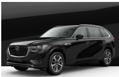
JET BLACK | €850 €714,29

Verwenden Sie unseren Konfigurator, um den Mazda CX-80 zu finden, der perfekt zu Ihnen passt.