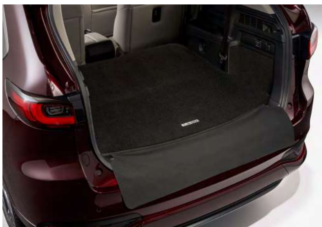
KOFFERRAUMMATTE MIT LADEKANTENSCHUTZ (FÜR HERUNTERGEKLAPPTE 3. SITZREIHE)