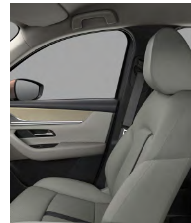
Sitzbezüge aus Nappaleder in Weiß 1) (TAKUMI UND TAKUMI PLUS)