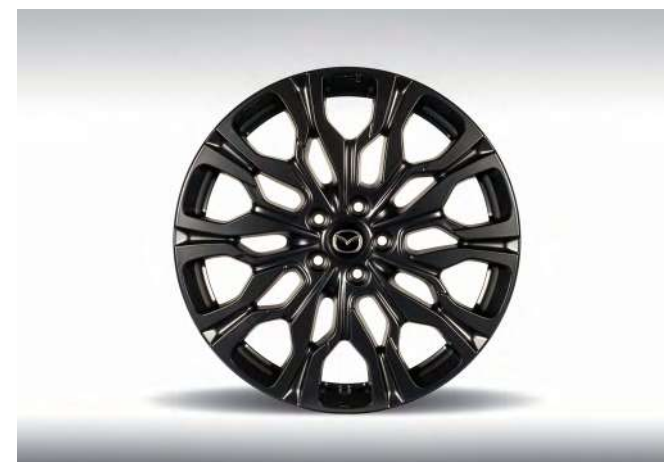
20-ZOLL-LEICHTMETALLFELGE, SCHWARZ MATT