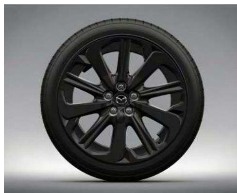
20-Zoll-Leichtmetallfelgen – Schwarz (HOMURA UND HOMURA PLUS)