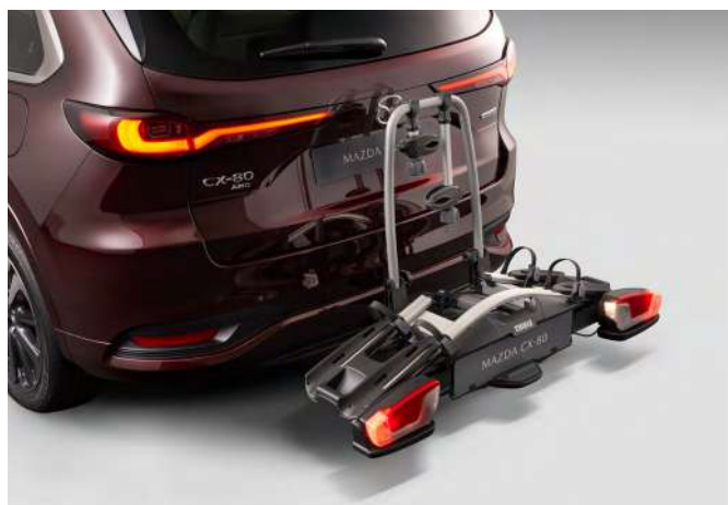
HECKFAHRRADTRÄGER FÜR ZWEI FAHRRÄDER