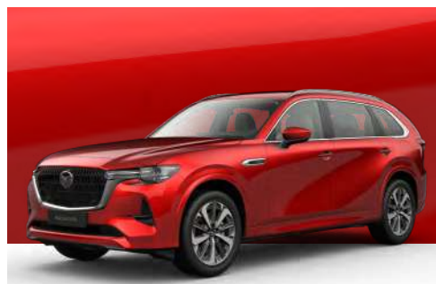
SOUL RED CRYSTAL | €1.200 €1.008,40