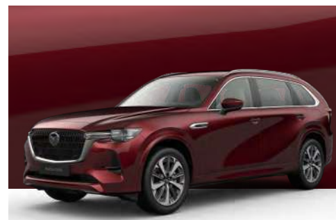
ARTISAN RED | €1.200 €1.008,40