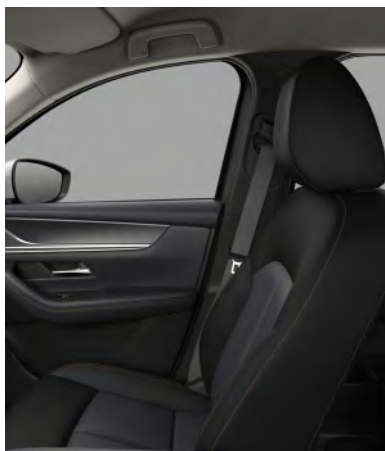
Sitzbezüge aus Stoff in Schwarz (EXCLUSIVE-LINE)