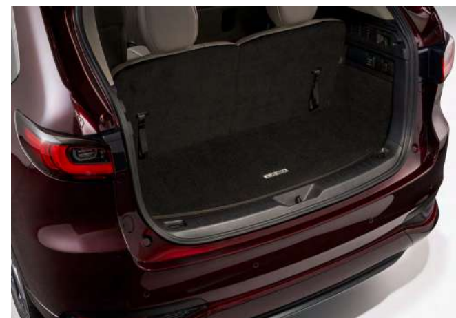
KOFFERRAUMMATTE MIT LADEKANTENSCHUTZ (FÜR HOCHGEKLAPPTE 3. SITZREIHE)

Weitere Informationen und Preise finden Sie in der Mazda CX-80 Zubehörliste unter https://www.mazda.de/formular/broschuere/ .