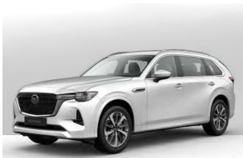
RHODIUM WHITE | €1.050 €882,35