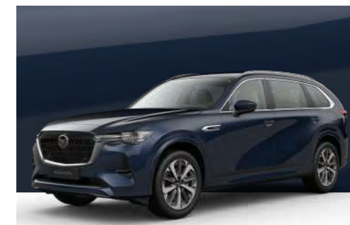
DEEP CRYSTAL BLUE | €850 €714,29