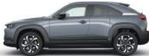
POLYMETAL GREY (47C) 2)