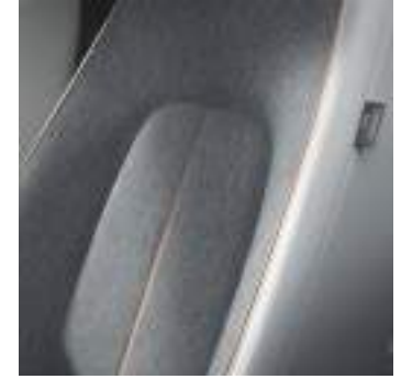
Innenraumkonzept Modern Confidence