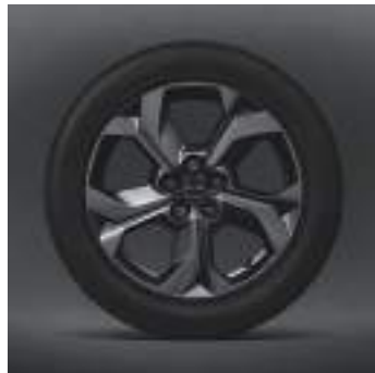
18-Zoll-Leichtmetallfelgen in Silbergrau mit Hochglanzfinish