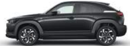
JET BLACK (41W) 1)