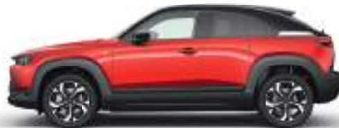
MULTI-TONE SOUL RED CRYSTAL (49V) 3)