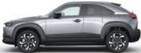
MACHINE GREY (46G) 2)