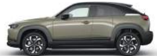
MULTI-TONE ZIRCON SAND (49T) 3)