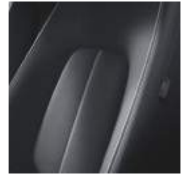
Innenraumkonzept Urban Expression (für Edition R inkl. Prägung der Frontkopfstützen und Edition-R-Fußmatten)