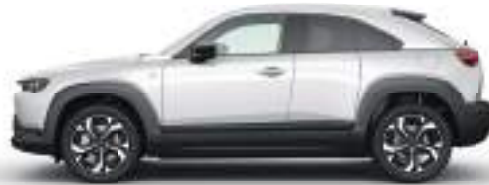
CERAMIC WHITE (47A) 1)