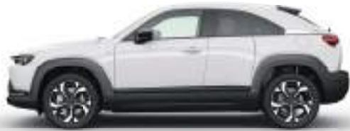
ARCTIC WHITE (A4D)