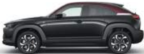
MULTI-TONE JET BLACK-MAROON ROUGE (49F) 4)