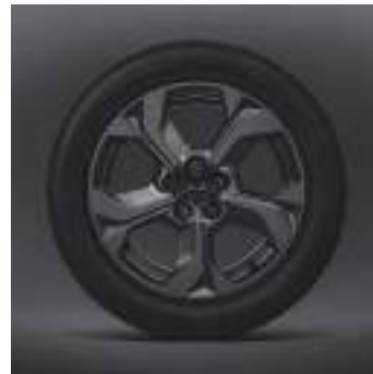
18-Zoll-Leichtmetallfelgen in Grey Metallic