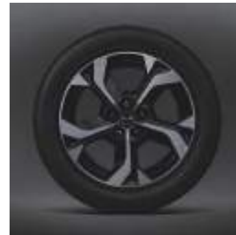
18-Zoll-Leichtmetallfelgen im Diamantschliff-Design