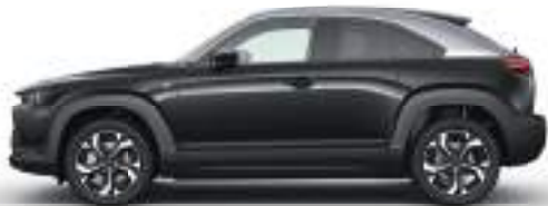
MULTI-TONE JET BLACK-SILVER (49P) 3)