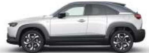
MULTI-TONE CERAMIC WHITE (48A) 3) :