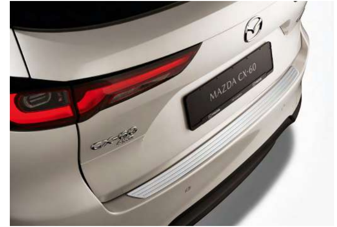
TRITTSCHUTZLEISTE FÜR DEN HINTEREN STOSSFÄNGER