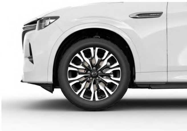
20-ZOLL-LEICHTMETALLFELGEN IM DIAMANTSCHLIFF-DESIGN