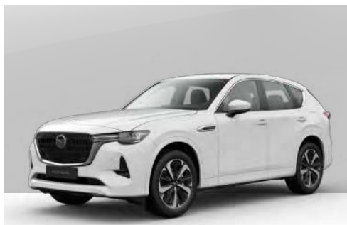
ARCTIC WHITE | ohne Aufpreis