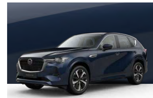
DEEP CRYSTAL BLUE | €850 €714,29