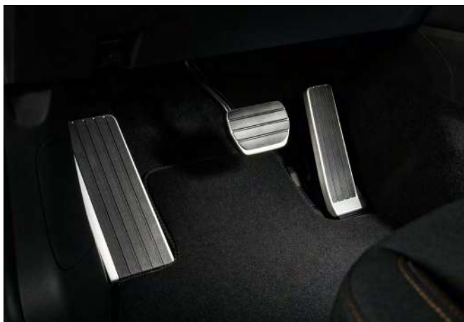
PEDALSATZ AUS ALUMINIUM