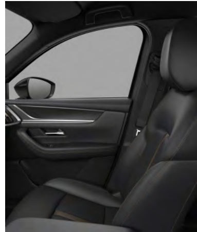
Sitzbezüge aus Nappaleder in Schwarz 1) (HOMURA UND HOMURA PLUS)