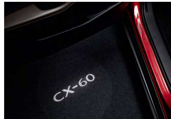
TÜR-PROJEKTOR MIT MODELLBEZEICHNUNG