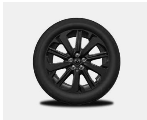
20-Zoll-Leichtmetallfelgen – Schwarz (HOMURA UND HOMURA PLUS)