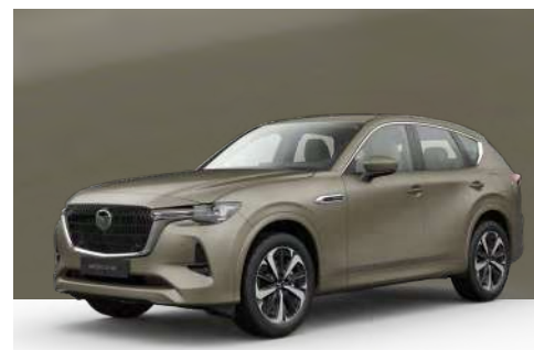
ZIRCON SAND | €850 €714,29