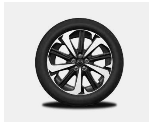
20-Zoll-Leichtmetallfelgen – Diamantschliff (TAKUMI UND TAKUMI PLUS)