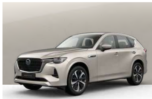
PLATINUM QUARTZ | €850 €714,29