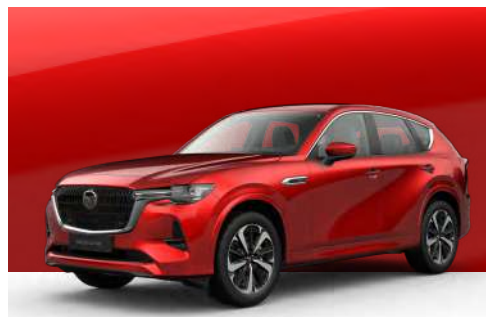
SOUL RED CRYSTAL | €1.200 €1.008,40