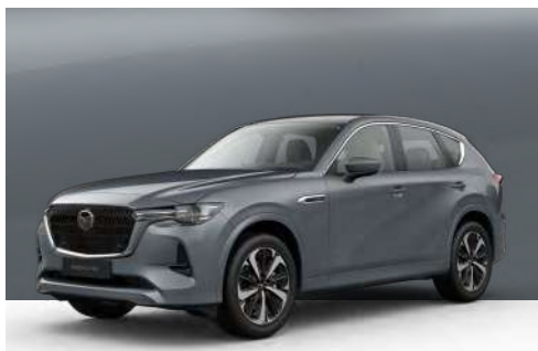
POLYMETAL GREY | €1.050 €882,35