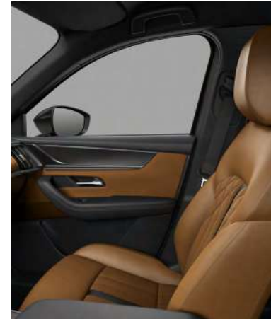
Sitzbezüge aus Teil-Nappaleder und Veloursledernachbildung in Hellbraun (OPTIONAL FÜR HOMURA UND HOMURA PLUS)