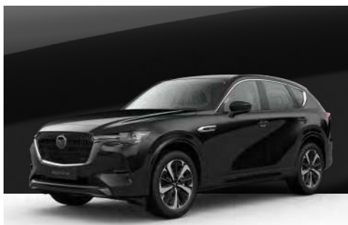
JET BLACK | €850 €714,29