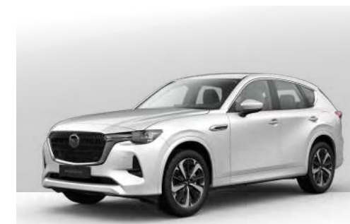
RHODIUM WHITE | €1.050 €882,35