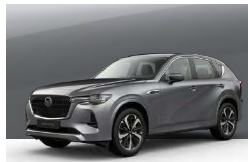
MACHINE GREY | €1.050 €882,35