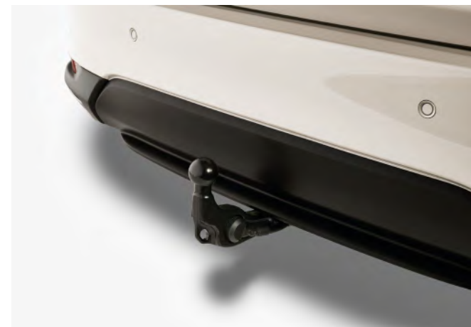
ANHÄNGEZUGVORRICHTUNG, TEIL-ELEKTRISCH SCHWENKBAR