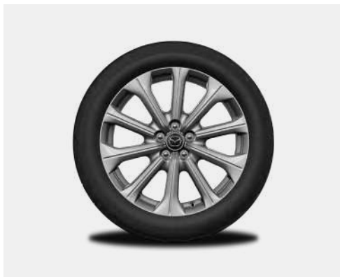
20-Zoll-Leichtmetallfelgen – Silber (PRIME-LINE UND EXCLUSIVE-LINE)