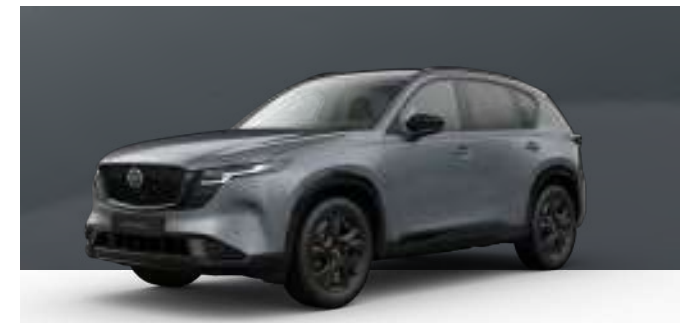
POLYMETAL GREY | 1.050 € 882,35 €