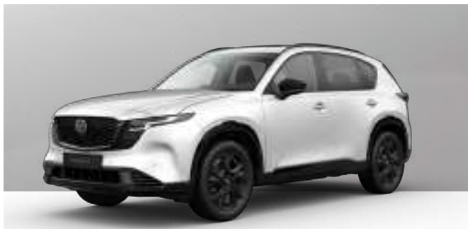
RHODIUM WHITE | 1.050 € 882,35 €