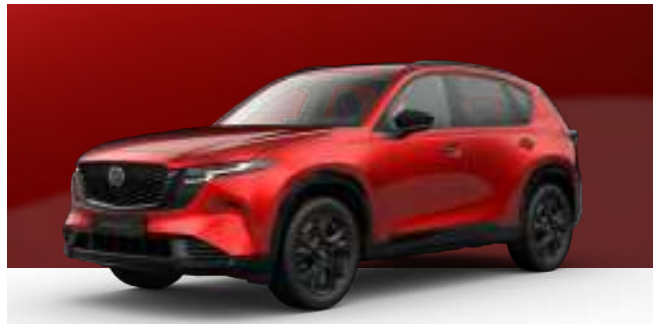
SOUL RED CRYSTAL | 1.200 € 1.008,40 €