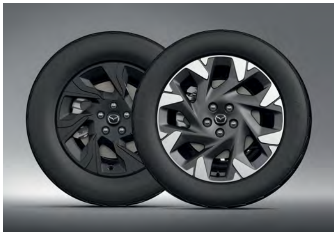
Leichtmetallfelge 17 Zoll (Design 78, schwarz matt) Leichtmetallfelge 19 Zoll (Design 79, Diamantschliff)