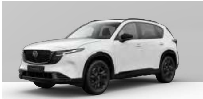
ARCTIC WHITE | ohne Aufpreis