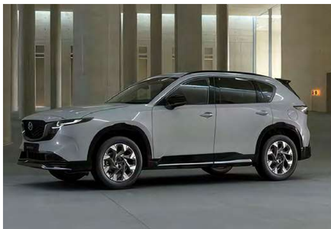
Sportliche Anbauteile (Front- und Heckschürze, Seitenschwellersatz und Dachheckspoiler)