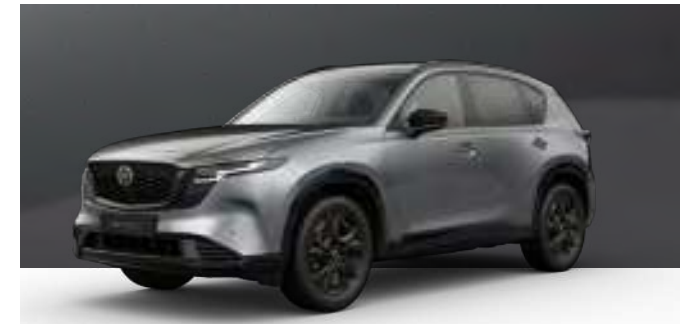
MACHINE GREY | 1.050 € 882,35 €