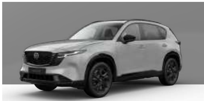
AERO GREY | 850 € 714,29 €