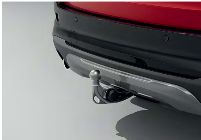
Anhängezugvorrichtung, voll-elektrisch schwenkbar