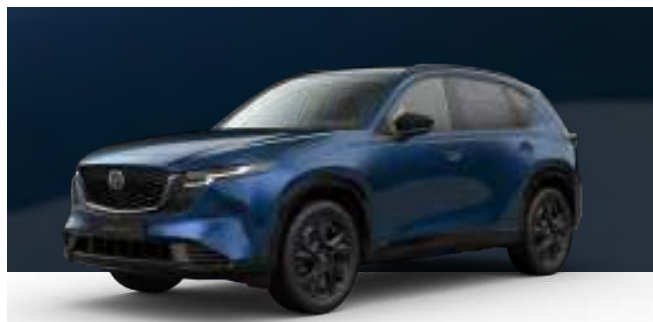
NAVY BLUE | 850 € 714,29 €

Verwenden Sie unseren Konfigurator, um den Mazda CX-5 zu finden, der perfekt zu Ihnen passt.