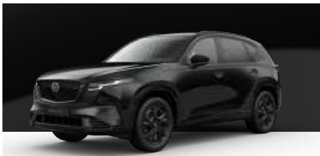
JET BLACK | 850 € 714,29 €