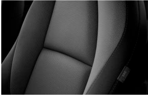
Stoffbezug in Dunkelgrau