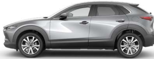
MACHINE GRAY (46G) 1)