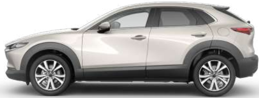
PLATINUM QUARTZ (47S) 1)