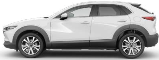
ARCTIC WHITE (A4D)