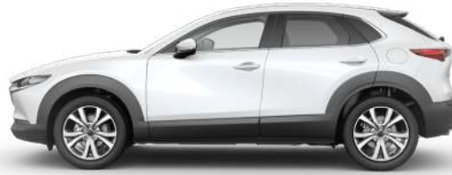
SNOWFLAKE WHITE (25D) 1)