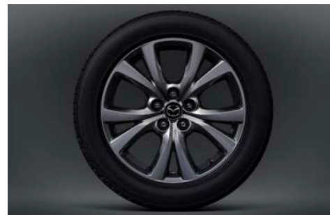
18-Zoll-Leichtmetallfelgen in Silbergrau mit Hochglanzfinish