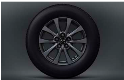
16-Zoll-Leichtmetallfelgen in Grau