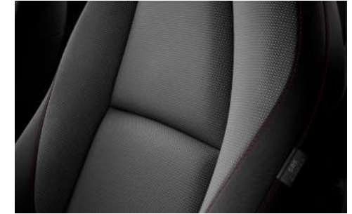
Stoffbezug in Schwarz mit roten Ziernähten