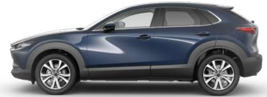
DEEP CRYSTAL BLUE (42M) 1)