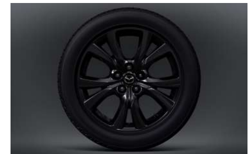
18-Zoll-Leichtmetallfelgen in Schwarz