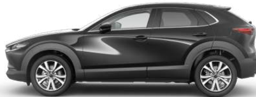
JET BLACK (41W) 2)