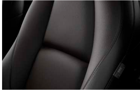
COMFORT-BLACK-PAKET Lederausstattung* in Schwarz