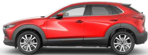
SOUL RED CRYSTAL (46V) 2)