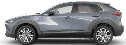
POLYMETAL GREY (47C) 2)