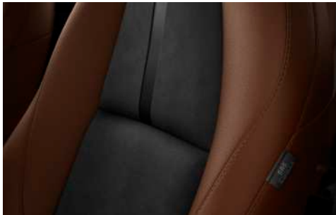
Sitzbezüge (Terrakotta Kunstleder/ Schwarz Leganu®)