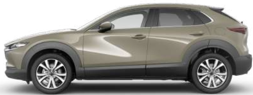
ZIRCON SAND (48T) 1)