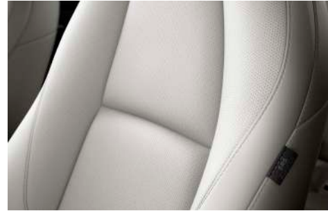
COMFORT-WHITE-PAKET Lederausstattung* in Pure White