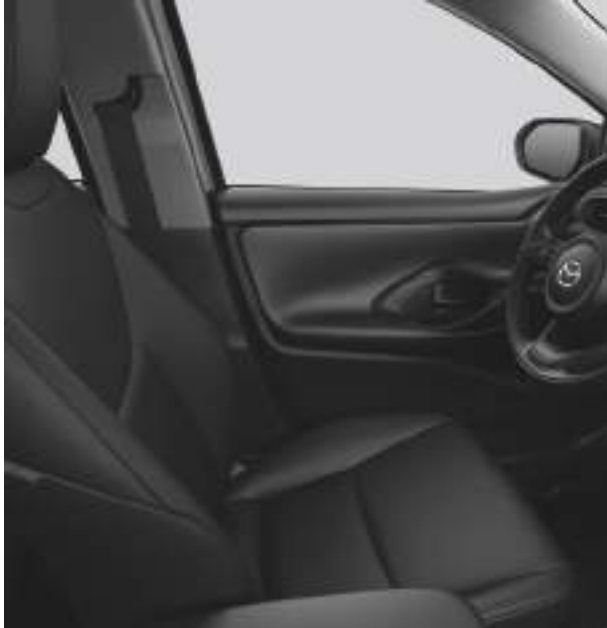
Stoffpolster in Schwarz für Prime-Line