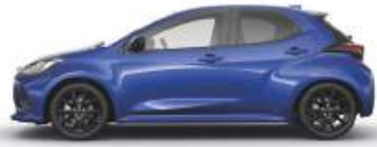
GLASS BLUE (50G) 1)