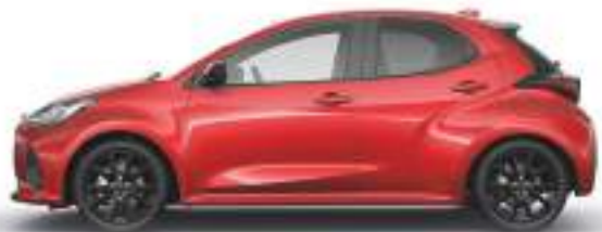
FORMAL RED (A9V) 2)