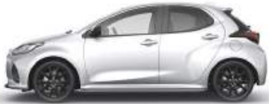
STORMY SILVER (49S) 1)