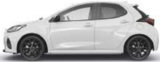
LUNAR WHITE (A8D)