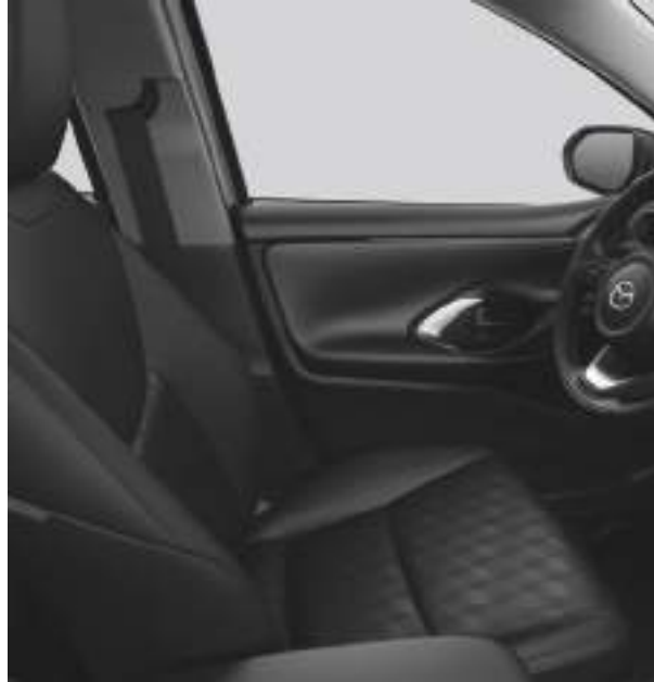
Stoffpolster in Schwarz für Centre- und Exclusive-Line