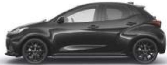
OPERA BLACK (49W) 1)