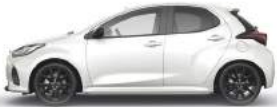
NORTHERN WHITE PEARL (48D) 2)