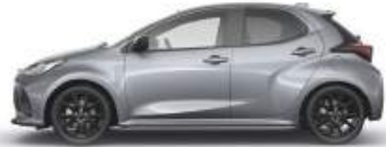
LEAD GREY (48G) 1)